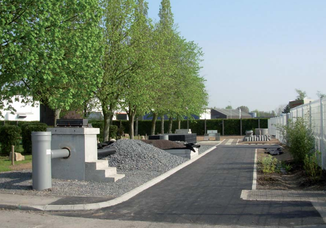
Showroom - Les différentes techniques exposées