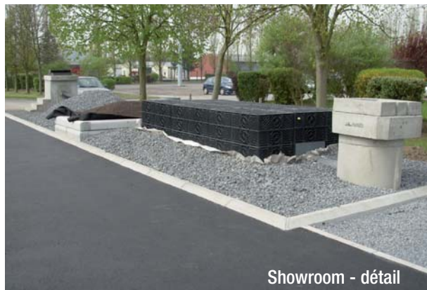
Showroom - détail